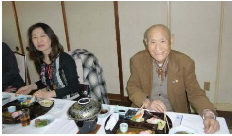
大内名誉会員が ご参加くださいました